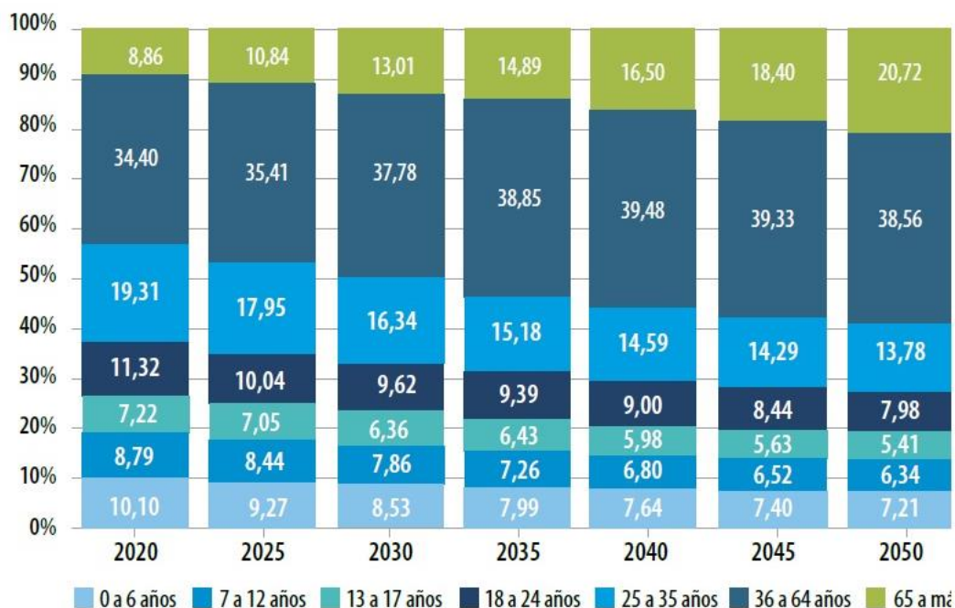
Gráfico Núm 1. Costa Rica: Población por grupos de edades proyecciones por quinquenios, 2020 - 2050

Fuente: Mideplan, Unidad de Análisis Prospectivo y Política Pública con datos del INEC. 3