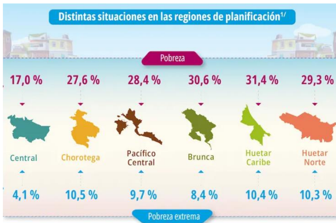
Figura 2. Cuadro de porcentajes de pobreza y pobreza extrema por regiones de Costa Rica