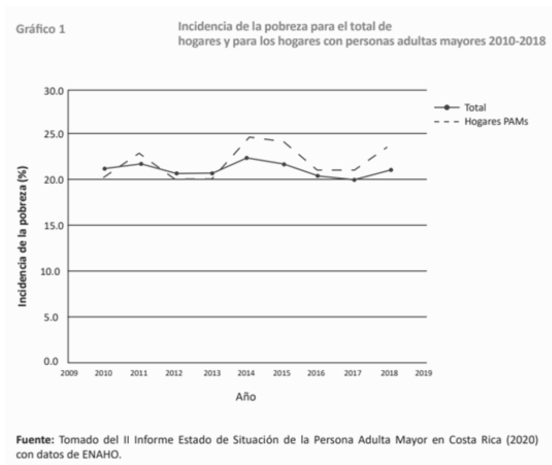
Figura 3. Cuadro incidencia de la Pobreza de hogares con Adultos mayores.

Según un informe de proyectos financiados con recursos de JUDESUR, suministrado al despacho legislativo de este servidor por esa misma entidad, esto entre los años 2000 y 2024, de 33 proyectos finalizados solo 5 de esos proyectos fueron destinados a efecto de poblaciones vulnerables, específicamente dirigidos a la población adulta mayor, en el área de acción donde opera la Junta.