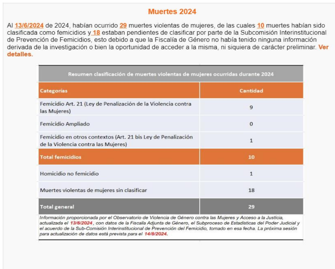
Figura 1. Femicidios 2024. Observatorio de Violencia de contra las Mujeres y Acceso a la Justicia

Esta página fue actualizada con datos al 13 de junio de 2024.